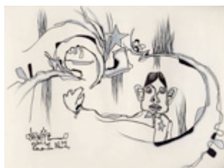
Davide Zucco Scatch Disegni 2001