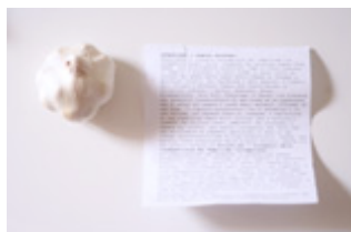
Giuliana Racco Attenzione i vampoiri esistono Installazione 2005

Archivio Luoghi San Marco Tito Altri eventi Cronologia anno 2008 anno 2007 anno 2006 anno 2005 anno 2004 anno 2003 anno 2002 anno 2001 anno 2000 anno 1999